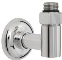
Набор комплектующих для ПК G 1/2" НР × G 1/2" НР арт. 03003-121