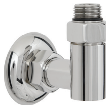
Набор комплектующих для ПК G 1/2" НР × G 3/4" НГ арт. 03002-1234